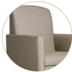
Fauteuil Heather entièrement rembourré.

Illustré en Bebop en amande BB45 avec fini noyer TWM. En couverture, illustré en Aldine en falaise AD25 avec fini noyer TWM.