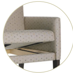
Sièges Heather - coussin d'assise amovible.