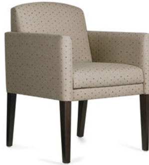
GC3771 Fauteuil club Heather à dossier bas.

L'élégance personnalisée, la gamme Heather saura attirer l'attention grâce à ses lignes franches et ses dimensions plus menues. Sa taille compacte l'avantage dans les espaces exigus, permettant une plus grande souplesse dans l'aménagement d'une pièce. D'élégants pieds effilés en bois dur ajoutent au charme de la gamme. Une housse munie d'une glissière en nylon enveloppe entièrement le coussin d'assise amovible et favorise un milieu sain et hygiénique. Le fauteuil Heather convient à merveille pour la salle de détente ou le hall d'entrée et trouvera sa place partout comme siège d'appoint.