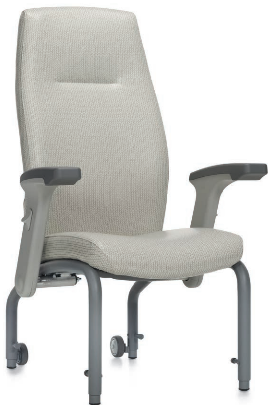
Fauteuil de patient à dossier haut avec support lombaire et appui-tête Schukra