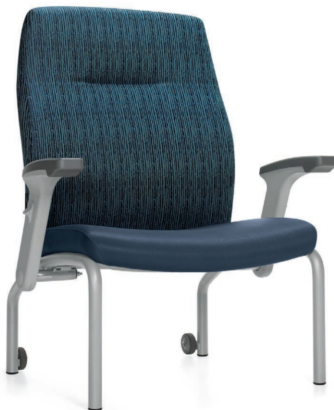
Fauteuil bariatrique de patient à dossier haut

La gamme Nourish MC a été mise au point avec le concours de professionnels chevronnés du domaine des soins de santé. La gamme propose des sièges novateurs à la fine pointe de la technologie qui se distinguent par des caractéristiques particulières adaptées à la morphologie et au degré de mobilité du patient. Pour faciliter le transfert en toute sécurité, chaque accoudoir peut s'escamoter, permettant un déplacement horizontal d'une surface à une autre, par exemple du lit au fauteuil, ou vice versa.